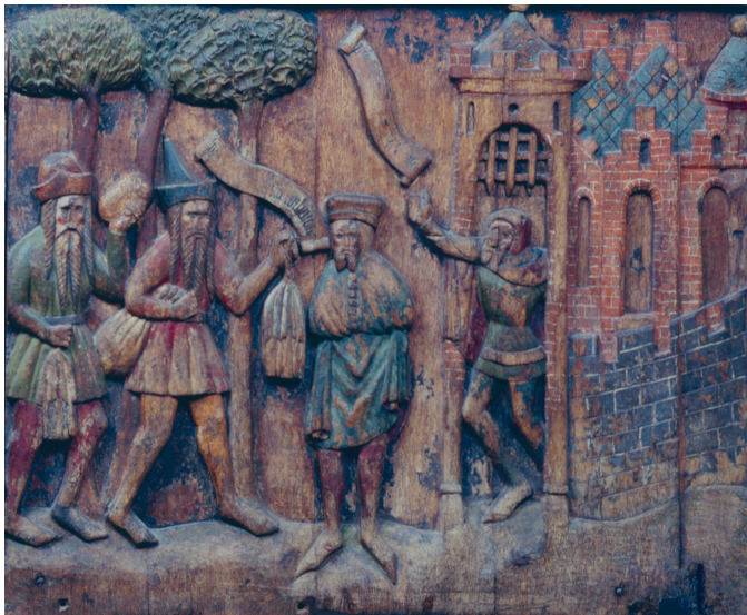
Abb. 3 Russische Jäger und Hansekaufmann. Relief des Rigafahrergestühls in St. Nikolai Stralsund, 1360/70.

Felle waren das wertvollste der Güter aus den endlosen Wäldern im Norden und im Osten, und diejenigen, die diese Waren – jahrhundertlang exklusiv – dort kauften und nach Mitteleuropa transportierten, waren Hansekaufleute. Diese organisierten ihren Handel mit Hilfe von Fahrerkompanien, die zwar nicht auf gemeinsame Rechnung handelten, sich aber auf einen bestimmten Handelsweg konzentrierten und dabei gegenseitig unterstützten, stets darum bemüht, diesen Handelsweg für sich zu monopolisieren. 6 So gab es neben vielen anderen etwa die Hamburger Utrechtfahrer, die Lübecker Schonenfahrer und die Stralsunder Rigafahrer. Für diese waren die Handelskontakte nach Nordost so wichtig, dass sie sie in Holz schnitzten und bemalen ließen, als sie um 1360/70 einen eigenen Altar in der Stralsunder Nikolaikirche errichteten. 7