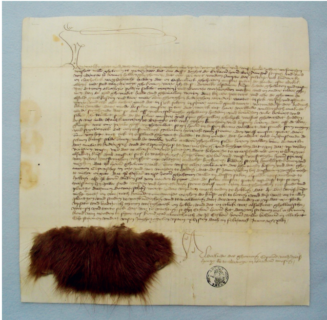
Abb. 5 Älteste bekannte datierbare Pelzprobe, überliefert im Zusammenhang mit innerhansischer Qualitätskontrolle von Handelswaren.