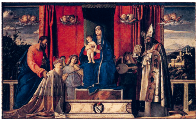
Abb. 1 Giovanni Bellini, Votivbild des Dogen Agostino Barbarigo, Murano, S. Pietro Martire, 1488.

Der Doge Agostino Barbarigo, der von 1486 bis 1501 an der Spitze der Republik stand, ließ zu Beginn seiner Amtszeit von Giovanni Bellini ein über 2 \times 3 m großes Votivbild anfertigen, das heute eher etwas abgelegen in der Kirche S. Pietro Martire in Murano hängt. 1 Darauf kniet der Doge halbwegs andächtig vor Maria und dem Kind. St. Markus persönlich, der Schutzpatron der Serenissima, empfiehlt ihn der Madonna, und Agostinos eigener Schutzpatron Augustinus und zwei musizierende Engel unterstützen das Anliegen. Trotz aller scheinbarer Demut verzichtet der Doge nicht auf die Symbole seiner Herrschaft: ein reich bestickter Corno ducale und ein weißes Cape aus Hermelinpelz, das er über einen langen Mantel trägt. Das Bild ist nahezu willkürlich aus Hunderten von einschlägigen Belegen ausgewählt; die Bedeutung des Capes für die Selbstdarstellung des Dogen liegt auf der Hand.