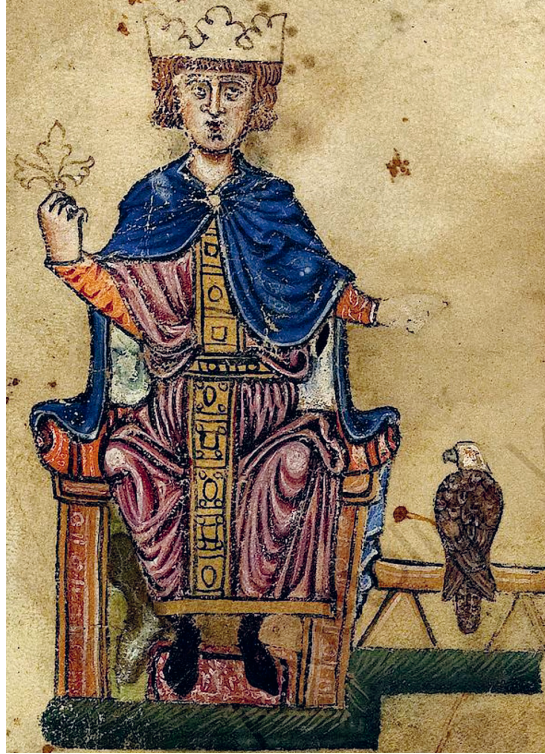
Abb. 4 Kaiser Friedrich II. und ein Jagdfalke.

demnach „geschenkt“; im folgenden Jahrhundert wird in Lübeck eine Falkensteuer erwähnt. 10 Die Travestadt stand spätestens seit ihrem Reichsfreiheitsbrief von 1226 in der Schuld des Kaisers und konnte ihm sicher deshalb kaum einen Wunsch abschlagen. 11