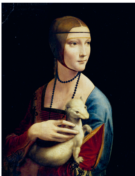
Abb. 2 Leonardo da Vinci, Dame mit dem Hermelin, Nationalmuseum Krakau, 1489/90.

Leonardo da Vinci malte es 1489/90, 3 also fast genau zur gleichen Zeit wie Bellini sein Dogenportrait, und es gibt Gelegenheit, wenigstens ein lebendiges Hermelin im Bild zu zeigen. Als einziger weiterer Beleg für die Popularität dieser Tiere in Italien sei der Hermelinorden erwähnt, der 1464 nach französischem Vorbild in Neapel gegründet und in den der Auftraggeber des Bilds, der Mailänder Herzog Ludovico Sforza, 1488 aufgenommen wurde. 4 Das Motto des Ordens Malo mori quam foedari – Lieber sterben als besudelt zu werden – spielt auf das weiße Fell des Tiers und damit auf Reinheit und Tugend an: einer der Gründe für die Beliebtheit der Hermeline und ihrer Felle.